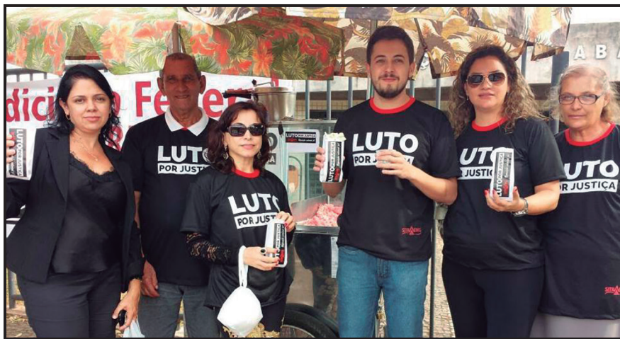
Luto por justiça - Reposição salarial

E, certamente, olhando para o nosso passado de vitórias, podemos vislumbrar um futuro em que vamos conseguir muito mais.