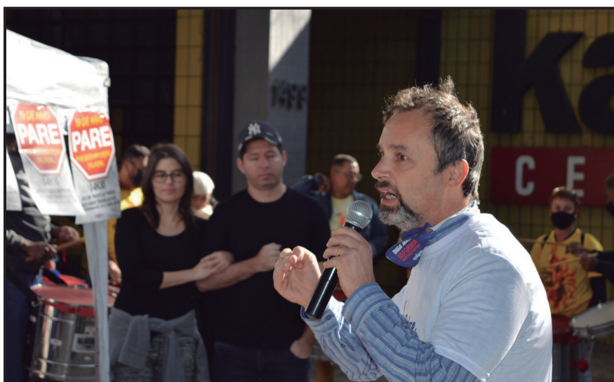
Reposição salarial 2015/2016