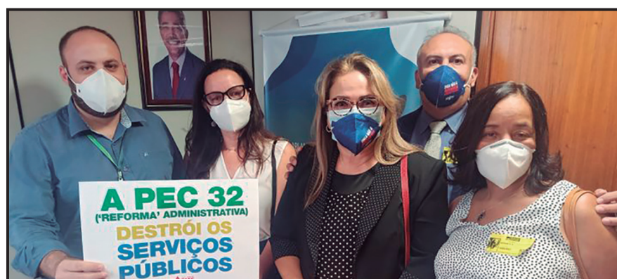
Derrubamos a PEC 32/2021/2022