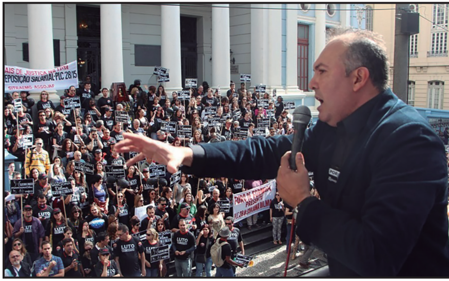
Greve histórica 2015/2016 (reposição salarial)