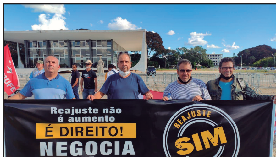
Reposição Salarial - 2021/2022

Nossas lideranças tiveram papel de destaque nesta luta. Construímos mobilizações em Minas Gerais e em Brasília, e fizemos forte investimento em propaganda (incluindo TV, rádios, outdoors, busdoors, carros de som), além de dezenas de idas a Brasília, pressionando os parlamentares.