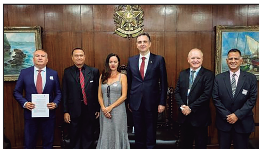
NS dos Técnicos - 2022

Com o fim do período mais crítico da pandemia, chamamos a categoria para ir à rua e construir os primeiros atos híbridos da campanha salarial. Derrotamos a política de congelamento. Menos de três semanas depois de encerrado o período de congelamento imposto pela Lei Complementar 173/20, no dia 20 de janeiro de 2021, o sindicato reunia-se com a presidente do STF para debater reajuste.