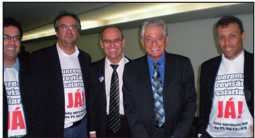
Reposição salarial 2009