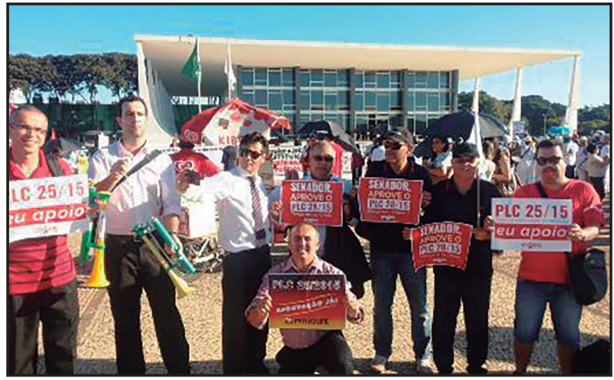
Greve histórica 2015/2016 (isonomia chefes cartórios)