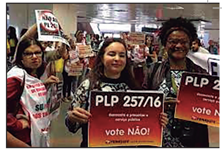
Em defesa da data-base